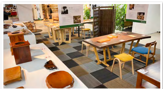
[木と手のしごと展の様子]