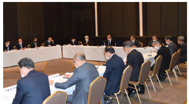
[第3回理事会の審議の様子]

なお、本年度の理事会はこれで終了し、次回の理事会は、本年度の決算など、通常総会に提出する議案などを諮るため、例年どおり新年度の4月以降に開催する予定となっています。